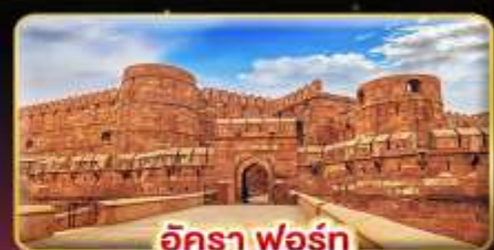
อัครา ฟอรั่ม