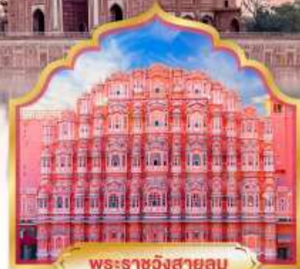
พระราชวังสายลม