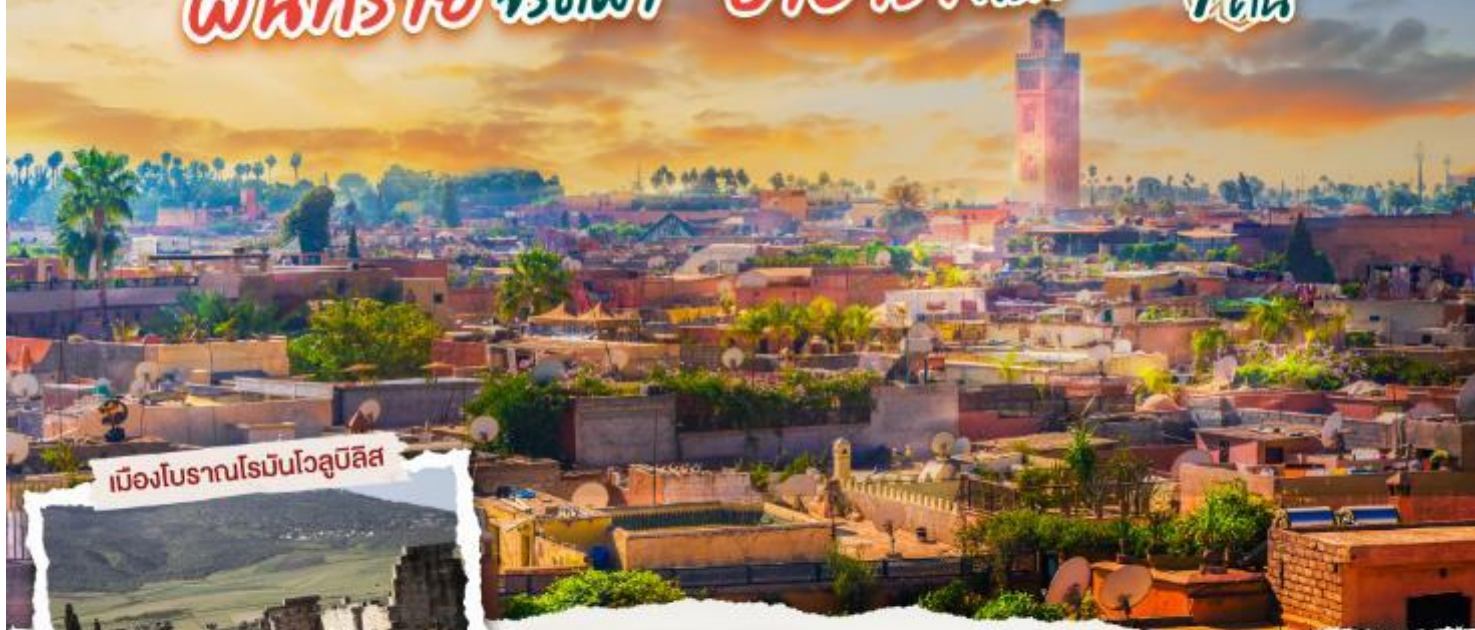
เมืองโบราณโรมันโวลูบิลิส