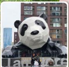
แพนด้าปิ่นตึก IFS