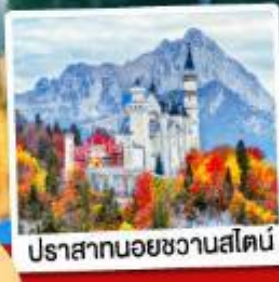
ปราสาทน้อยชวานส์ไตน์

02-08 พ.ค.69 24-30 มิ.ย.69 02-08, 16-22 ก.ย.69