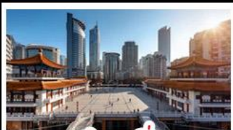
ตึกชุยซิ่ง

พระแกะสลักหินต้าจู้ - หลุมฟ้าสะพานสวรรค์ - เจานางฟ้า ตึกชุยซิ่ง - ตึกตะเกียบ - หมู่บ้านโบราณฉือซีโจว