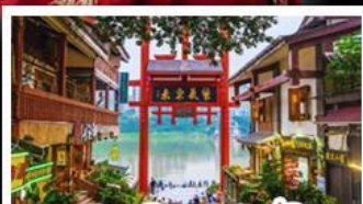
หมู่บ้านโบราณฉือซีโจว