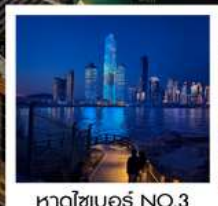
หาดไซเบอร์ NO.3

ทัวร์คุณธรรม ไม่ลงร้านช้อปปิ้ง ไม่ขายออฟชั่น