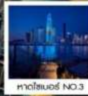
หาดโซเบอร์ NO.3

ของที่ระลึก สุดพิเศษ!! ขวดเบียร์สกรีนรูปของท่าน รัับฟรี!! ท่านละ 1 ขวด