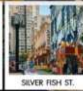
SILVER FISH ST.