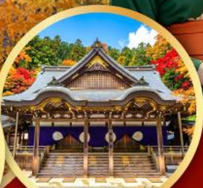
ศาลเจ้าฮิสะ