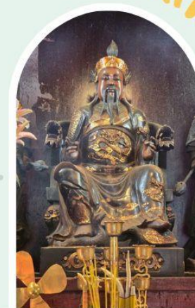
วัดปักไต้