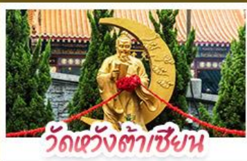
วัดเข่งต้าเซียน