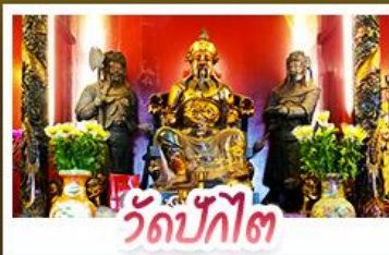
วัดปักไต่