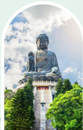
พระใหญ่โป่หลิน