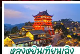
หลงหยินเทียนเจิง