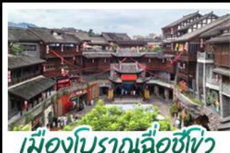
เมืองโบราณฉือซีโขง

อุทยานสี่ดรุณี - อุทยานเขานางฟ้า อุทยานหลุมบ่อฟ้า - เมืองโบราณฉือซีโขง หลงหยินเทียนเจิง - หงหยาดัง