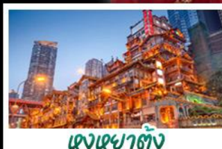
เขงเซาตัง