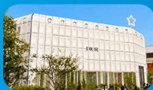
บริกอินเกาหลี