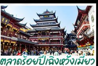
ตลาดร้อยปีเฉิงหวังเมียว