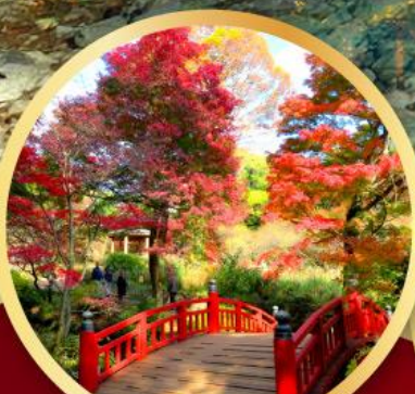
สวนดอกบ๊วยอาคาบิ