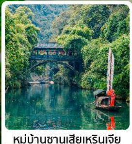
หมู่บ้านซานเสี่ยเหรินเจีย