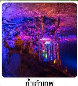
ดำเก้าทพ