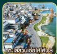
ทะเลสาบเอ๋อไห่คัง S