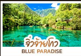
จิวจ้ายโกว BLUE PARADISE