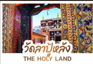
วัดลาปูหลง THE HOLY LAND

หนึ่งศรัทธา: สัมผัสความสงบและสถาปัตยกรรมทิเบตที่ วัดลาปูหลง หนึ่งผืนหญ้า: ล่องลอยไปในความเขียวจีของทุ่งหญ้ากานหนาน หนึ่งสายน้ำ: ค้นพบความงามเหนือกาลเวลาที่ จิวจ้ายโกว