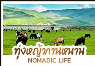
ทุ่งหญ้ากานหนาน NOMADIC LIFE