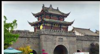
เมืองโบราณกวนเซี่ยน

ภูเขาสี่ดรุณี - อุทยานป่ฝิงโกว - สะพานหมานเฉียว - ร้านหนังสือจงซูเก๋ - เมืองโบราณกวนเสี้ยน จตุรัสหยางเทียนหวู่ - หมีแพนด้าเซอเฟี - ถนนโบราณชอยกวางชอยแคบ - ถนนคนเดินไท่กู๋หลี่ ถนนคนเดินซุนซี - ถนนโบราณจินหลี่ - แพนด้ายักษ์ปิ่นตึก - น้ำพุไม้ไผ่ตึกSKP - วัดต้าอ้อ