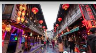
ถนนโบราณจินหลี่