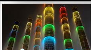
น้ำพุไม้ไผ่ตึกSKP