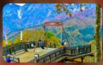
ฮาคุบะ-อิวาซากะ