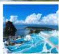
ซานโตรินี่ต้าหลี่

“เกาะเสี่ยวผู...เกาะลึกลับกลางทะเลสาบ เอ้อไห้”