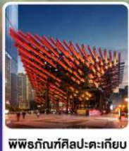
พิพิธภัณฑ์ศิลปะตะเกียบ