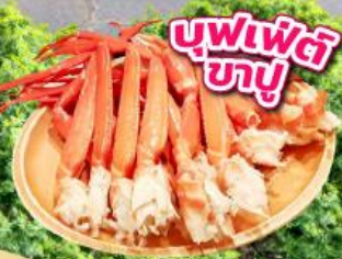
บุฟเฟ่ต์ ซาซุ