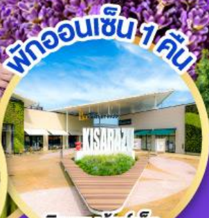
มิตซูยะ เอ้าท์เล็ต พาร์ค คิซะระซู