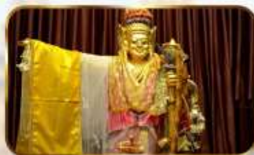
เทพทันใจโจ้เข้า