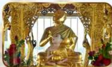
ขอพระพระอุปัฏฐ ปางจกบาตริเยียมาร