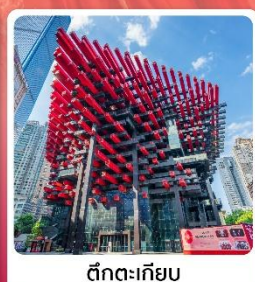
ตึกตะเกียบ

ไฮไลท์! เกี่ยวกับอุทยานแห่งชาติหลุมบ่อฟ้า มรดกโลกระดับ 5A ชมรถไฟฟ้าทะลุตึก อลังการแสงสีที่หงหยาดัง