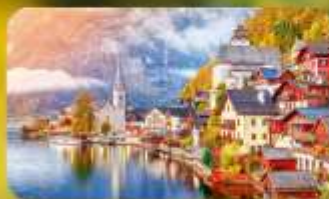
การันตีพัก Hallstatt / St. Wolfgang หรือริมทะเลสาบ 1 คืน