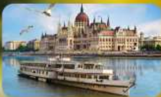
ส่องเรือแม่น้ำดานูบ พร้อมจิบแชมเปญ