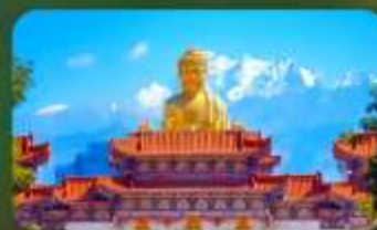
วัดพระใหญ่หรงกวงซาน