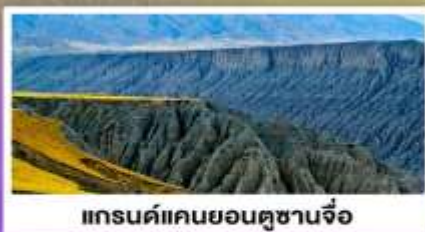
แกรนด์แคนยอนตูซานจื่อ