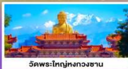
วัดพระใหญ่ทงกวงชาน