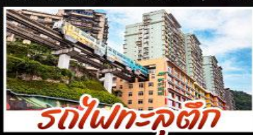
รถไฟฟ้า-คูตัก