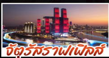
จัตุรัสราฟาเอลส์