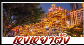
แสงอาคารต่าง

สัมผัสประสบการณ์เที่ยวจีนแบบเต็มอิ่ม ทั้งความล้ำสมัยของมหานครฉงชิ่ง และความงดงามตระการตาของธรรมชาติที่จุหล่ง ทุกการเดินทางเต็มไปด้วยความสะดวกสบายและคุ้มค่าที่สุดราคา!