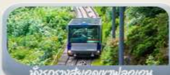
นั่งรถรางสวยอดเขาฟลอมอน