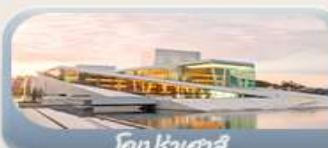
โอปราเฮาส์

สักครั้งในชีวิตกับการนั่งรถไฟสายโรแมนติกฟลัมสบาน่า สองเรือชมฟยอร์ด ขึ้นกระเช้าลอยฟ้าพิชิตยอดเขาอูสริเคน เบอร์เกน นั่งรถรางสวยอดเขาฟลอมอนชมวิวเมือง ออสโล เยี่ยมชมโอปราเฮาส์ มหาวิหารออสโล ป้อมปราการอาครส์ฮูส สวนอนุสรณ์ชาติ Vigeland Sculpture Park