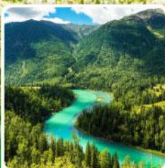
ทะเลสาบคานาสีอู