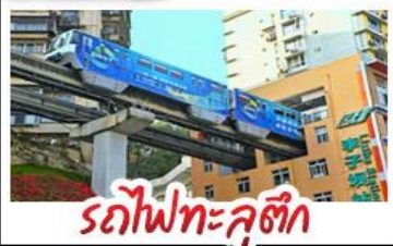
รถไฟทะลุตึก