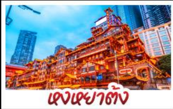
เจงเฮงต้ง