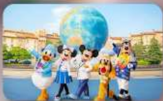
อีสระตามอียาสัย 2 วัน

HOTEL ASIA NARITA ห้องเตียงสามมาตรฐานคู่เตียง