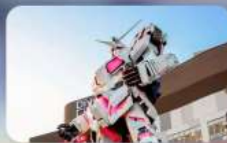
ช้อปปิ้งโอโดบะ