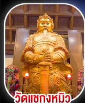
วัดเขกหมิว