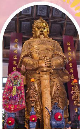
วัดแซกกง ขอพรโชคกลาง การเงิน และธุรกิจ