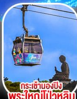
กระเช้าเองปีง พระใหญ่โป่วหลิน