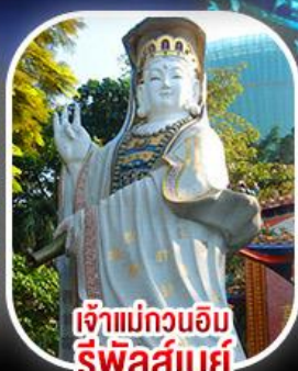
เจ้าแม่กวนอิม รีพบลัสเบย์