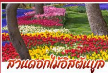
สวนดอกไม้อิสตันบูล