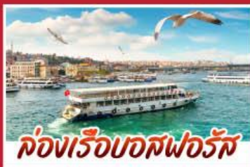
ล่องเรือบอสฟอรัส