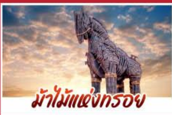
น้ำไม้แห่งกรอย