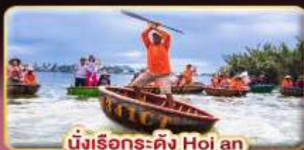
นั่งเรือกระด้ง Hoi an