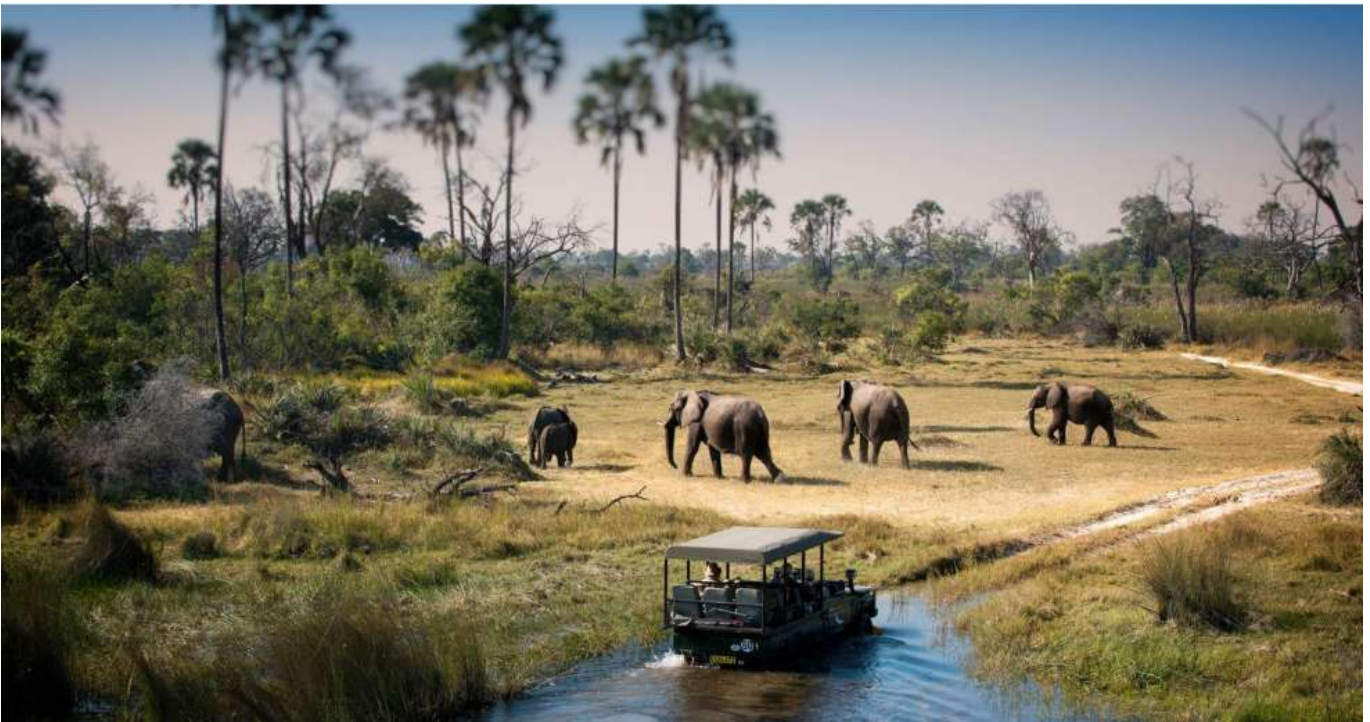
วันหยุดที่ดีที่สุดที่ 6 สิงหาคม 2569 Chobe National Park Botswana - Zambezi Sundowner cruise