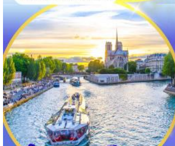
ล่องเรือแม่น้ำแชน