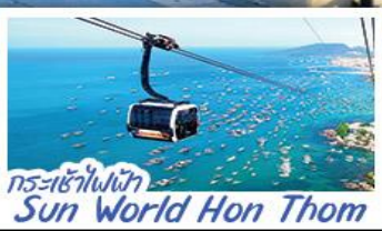
กระเช้าไฟฟ้า Sun World Hon Thom