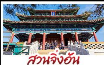
สวนจิ่งอัน