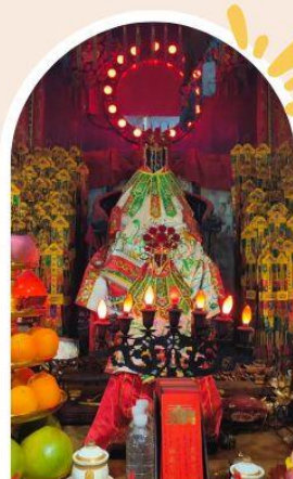
วัดเจ้าแม่กวนอิมอ่องฮำ ขอพรเรื่องเงิน ทรัพย์สิน และความมั่งคั่ง