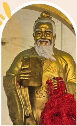
วัดหวังต้าเซียน ขอพรสุขภาพ ความรัก