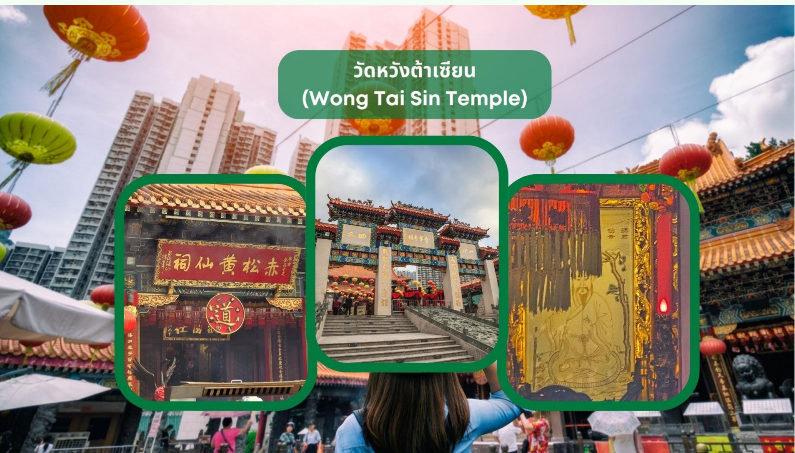
วัดหวังต้าเซียน (Wong Tai Sin Temple)

รับประทานอาหารเช้า ณ ภัตตาคาร บริการท่านด้วยเมนูติ่มซำฮ่องกง (มื้อที่ 3)