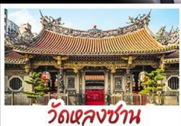
วัดเจหลงชาน