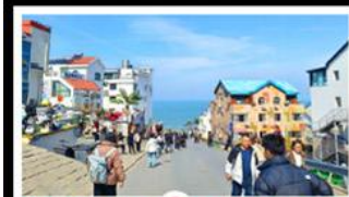
ถนนคอปเพิลิงหมายเลข 8

สัมผัสความยิ่งใหญ่ของ 4 เมืองสำคัญ ชิงเต่า - เยียนโก - เฟิงไฮล - เว่ยไห่ ปาต้ากวน - โบสถ์คาทอลิก - ตึกเก่าริมหา