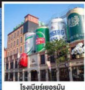
โรงเบียร์เยอรมัน