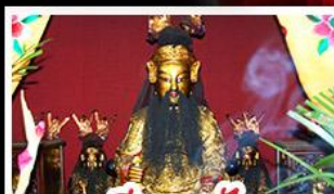
เอียงบูซิว