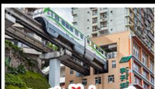
สถานีรถไฟทะเลสาบ

อุ้งหล่ง - อุ้งหล่ง - หงหยาดัง อุทยานเขานางฟ้าอุ้งหล่ง สถานีรถไฟทะเลสาบ หมู่บ้านสามสะพานสวรรค์