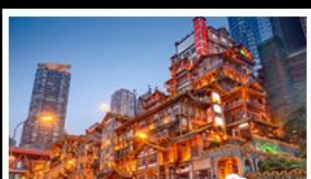
ตลาดเขานางฟ้า