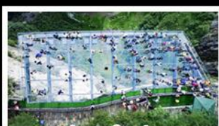
ระเบียงแก้วอุ้งหล่ง