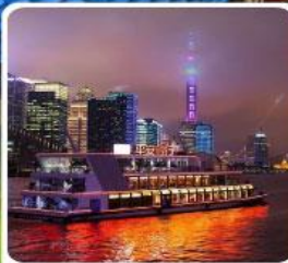
ล่องเรือแม่น้ำหวงผู่