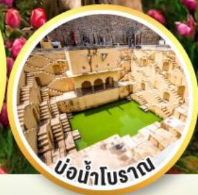
บ่อน้ำโบราณ