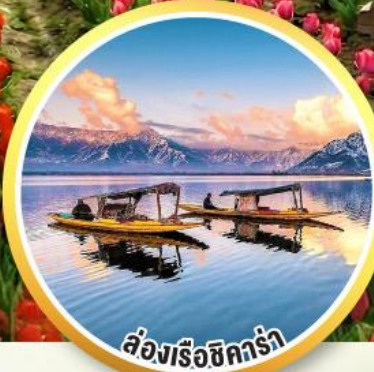
ล่องเรือชิคร่า