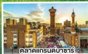
ตลาดแกรนด์บาซาร์