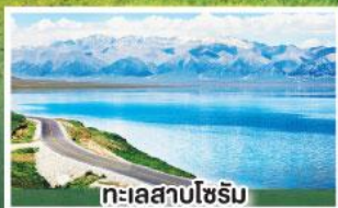
ทะเลสาบไซรัม