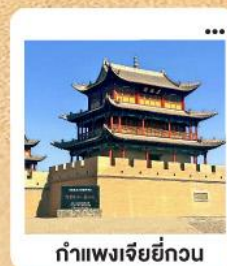
ต้าแพงเจียยี่กวน