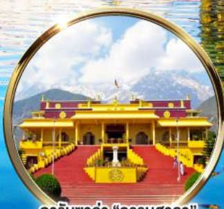
ดาริมซาล่า "ธรรมศาลา" ตำนานทองคำดาโลลามะ