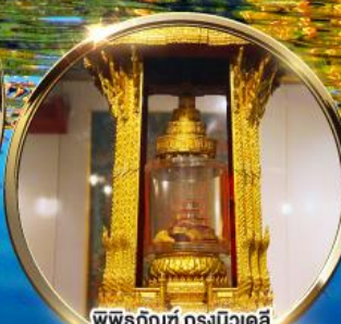
พิพิธภัณฑ์ กรุงนิวเดลี ถرابนัมัสการพระบรมสารีริกธาตุ