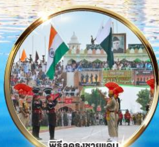
พิธีลดธงชัยแดน อินเดีย-ปากีสถาน ผ่านวากาห์