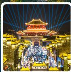
เมืองโบราณเซียงหยาง