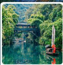
หมู่บ้านชาบเซียงหยาง