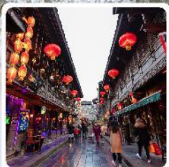
ถนนโบราณจีนหลี