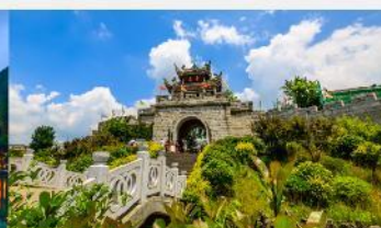
เมืองโบราณซิงเหยียน

*ทางบริษัทฯ ขอสงวนสิทธิ์ในการสลับโปรแกรมทัวร์ตามความเหมาะสมขึ้นอยู่กับสถานการณ์หน้างาน โดยคำนึงถึงผลประโยชน์ของลูกค้าเป็นสำคัญ