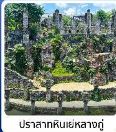
ปราสาทหินเย่หลางกู่

● ไฮไลท์ น้ำตกหวงกั๋วซู่ น้ำตกที่ใหญ่ที่สุดของจีน แหล่งท่องเที่ยวระดับ 5A ชมความสวยงาม หมู่บ้านวูเจียงจ้าย หมู่บ้านจีนโบราณ