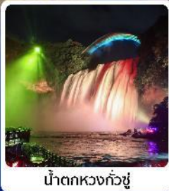
น้ำตกหวงกั๋วซู่